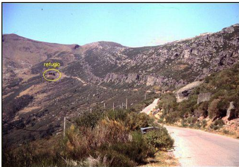
Último tramo de la dura ascensión. Es la zona más asequible, pero no hay que relajarse.

Para superar una de estas pruebas es necesario tener una notable capacidad de sufrimiento, con la que soportar y superar las dificultades que van a presentarse. Hay que seguir adelante a pesar de los momentos de decaimiento y de zozobra. La satisfacción que la conquista de uno de estos monstruos produce en el atleta, es puro placer de dioses, reservado a unos pocos. Será el único y merecido premio que va a encontrar en esa cima que parece estar siempre al doblar esa última curva, situación que se repite de manera sistemática, como espejismo inalcanzable.