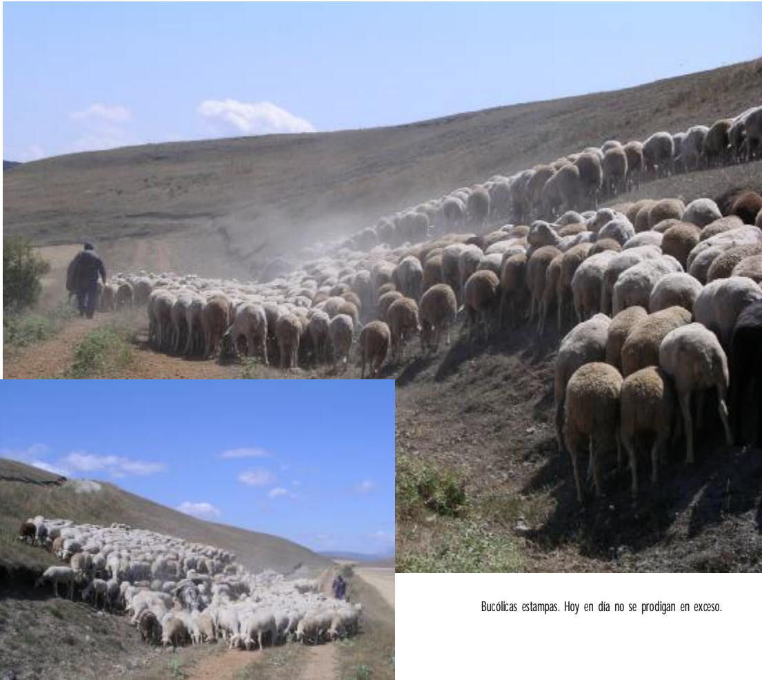
Bucólicas estampas. Hoy en día no se prodigan en exceso.