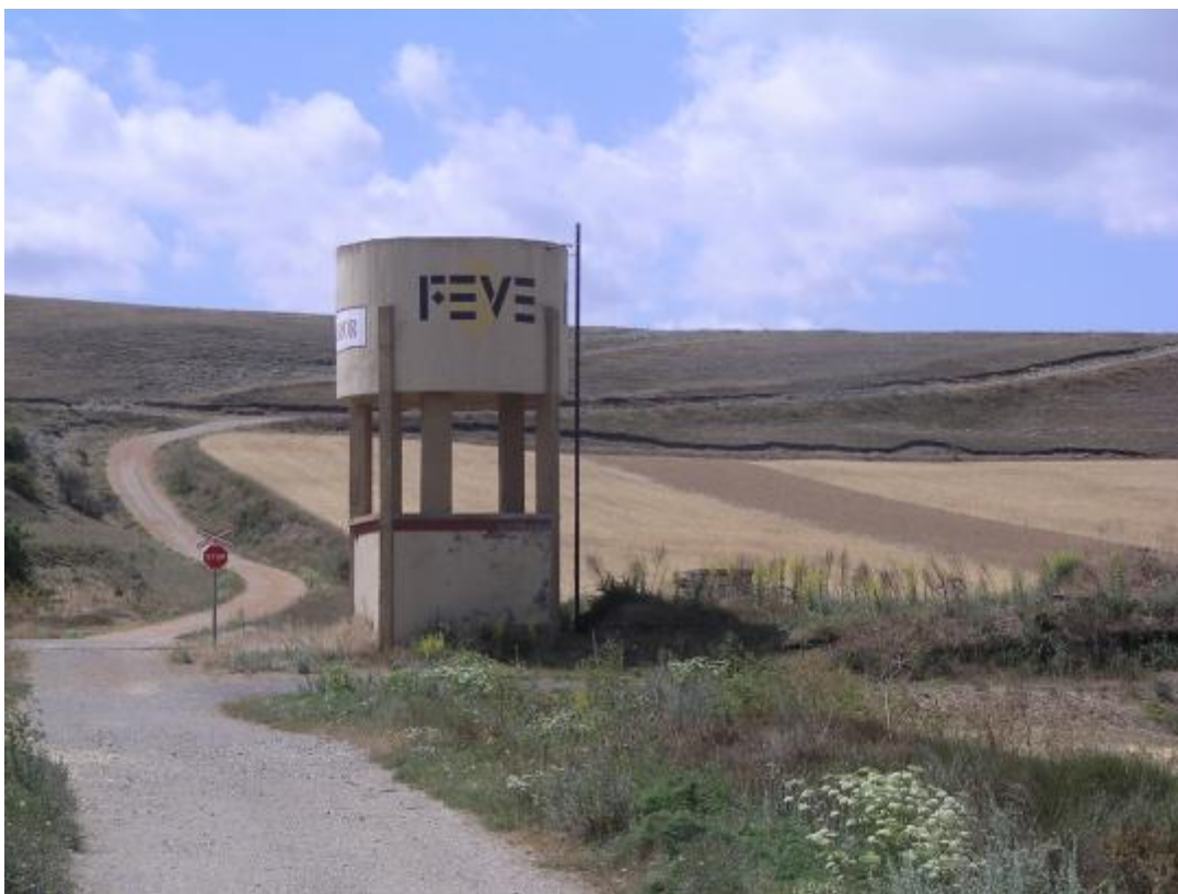
Salvado el duro escollo de la imagen, el camino nos conducirá a Matalbaniega.

Km. 17,020 Paso a nivel. Vamos a encarar el durísimo repecho comentado en la narración de la ida. Las notables dificultades del piso de tierra y piedra suelta, sumadas a la extrema dureza de la pendiente, 19 %, crean un importante problema de estabilidad. Uno, que ha dejado a una cierta distancia los 20 años, siente que su espíritu de ciclista se doblega e hinca la rodilla.