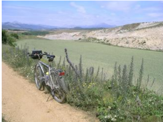
El camino está cerca de la cantera. Salinas ya muy próxima.

Km. 29,530 Da comienzo la ascensión. Muy dura al principio. Presenta muros de hasta el 15 % de inclinación. Por fortuna pronto va a cambiar el panorama. Paulatinamente va suavizando, para convertirse al final en un falso llano, pero hay que continuar dando pedales hasta alcanzar el pinar.