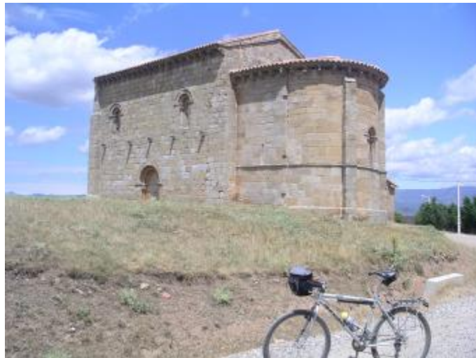
MATALLANA DE LOS RÍOS. Iglesia parroquial de San Martín, románica, s. XII.