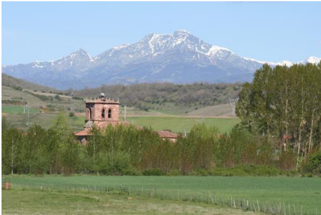
SALINAS DE PISUERGA. Acabar la ruta y encontrar una bella estampa como la presente, sería el mejor premio a una dura jornada. Va a depender de la época del año en que la afrontéis.

Km. 31,780 Se pasa a la altura de una cantera. El piso, a veces, no es demasiado bueno.