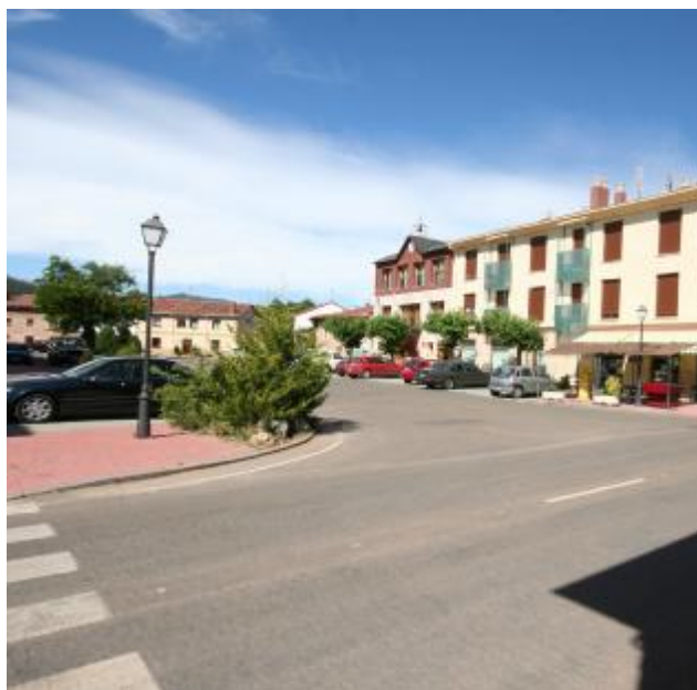
Plaza y Ayuntamiento. Al fondo, a la izquierda, la morera.

A mano derecha, el frontón. Comienza el camino, de tierra compactada y piedra.