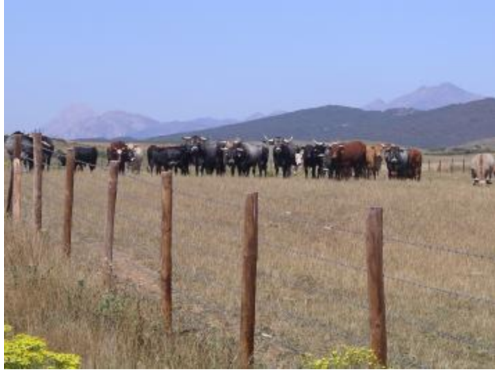
Uno que no se cansa de hacer loas a la cordillera, no sabe si decantarse ahora por el ganado vacuno.

Km. 26,380 Abandonar la carretera tomando un camino hacia la mano derecha, en ángulo de 90°. Pasa el camino entre ganado vacuno y caballar. No existe peligro. Está vallado.