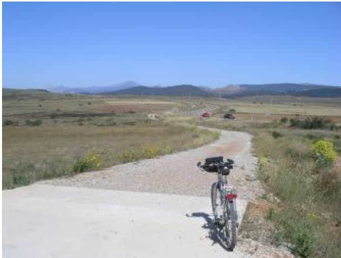
Camino junto a la rotonda. En paralelo a la vía asfáltica.

Km. 27,050 Giro a la izquierda. Hacia la carretera Aguilar-Cervera.