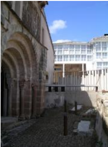
Portada norte, enterramientos y galerías

Km. 15,920 Paso a nivel en la, tantas veces aludida, vía de FEVE.