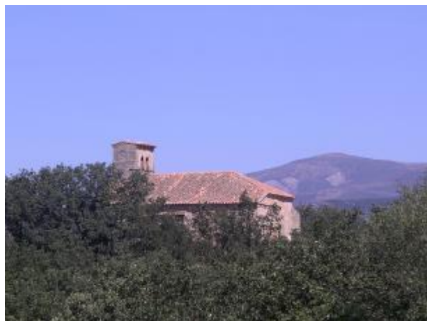
Iglesia de San Juan Bautista de Matamorisca en un bello asentamiento.

A mano derecha, a una cierta distancia, pero perfectamente identificable aparece un pueblo.