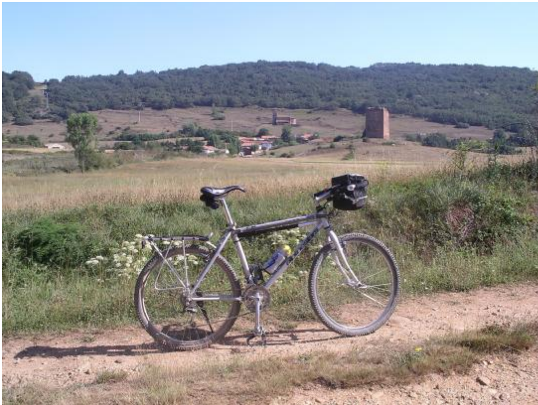
Villanueva de la Torre. Este camino nos ofrece una nueva perspectiva del pueblo, su torre y su iglesia.