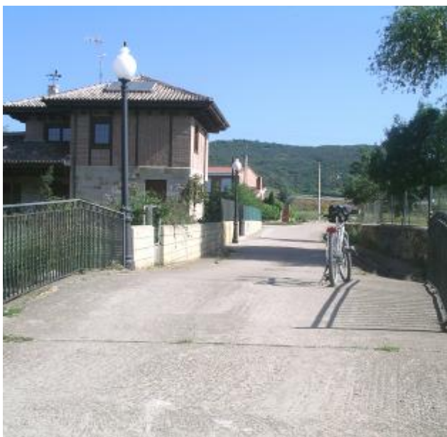
Puentecillo sobre el arroyo. El camino continúa recto.

Al fondo vemos un paso inferior que cruza bajo la carretera Aguilar-Cervera. Pasarlo, e inmediatamente superado el túnel, giro de 90° a la dcha.