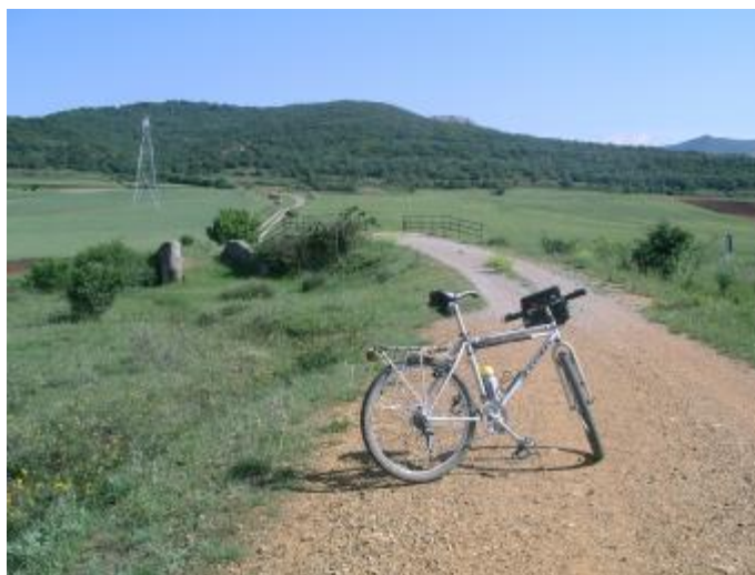
Dos puentes. Los dos perfectamente válidos para bicicletas o senderistas.

Km. 1,150 Cumbre. A mano izquierda vemos dos puentes sobre la vía de FEVE, línea Bilbao-León. A la izquierda, el primitivo, de piedra. A la derecha otro, de hormigón, por el que va el camino. Quien desee evocar viejos tiempos puede pasar por el primero y, una vez superado, recuperar la ruta actual.