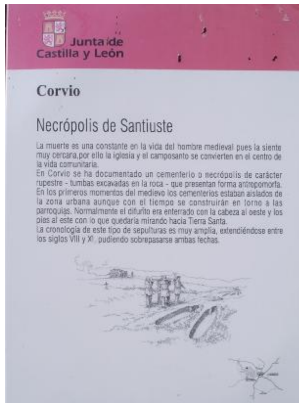
Panel informativo que se encuentra junto a los sepulcros de Corvio.