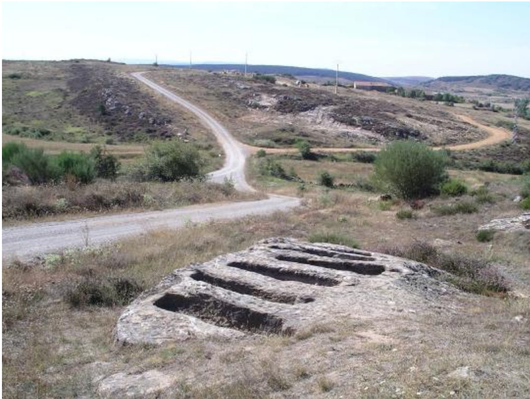
Necrópolis de Corvio. Gráficamente son apreciables los distintos caminos comentados en el texto. El que seguiremos es el de color gris. Al frente.