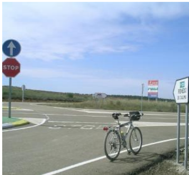
Rotonda de Matamorisca. Cruzar la carretera y giro inmediato a la derecha.

Km. 28,520 Continuar al frente izquierda.