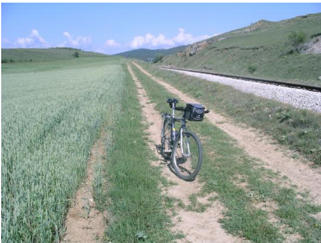
Demostración gráfica de la descripción del texto. Cereal, camino y rieles.

El trayecto actual nos recuerda a las fascinantes Vías Verdes. Circulamos encajonados entre el ferrocarril y los campos de verde cereal.