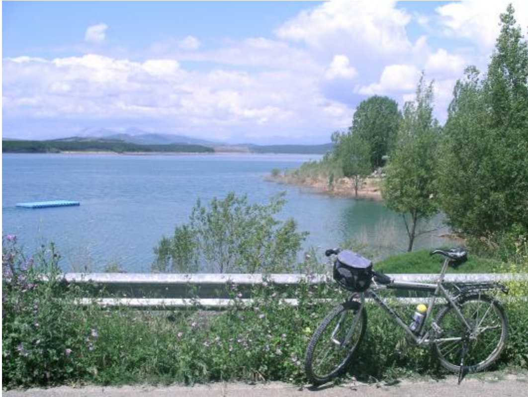
Pantano de Aguilar. Próxima al lugar se este encuentra una de sus playas.

Km. 23,150 Abandonar la carretera y tomar un camino, a mano derecha. En descenso hacia Corvio. Lo tenemos al alcance de la vista, ahí abajo. Su imagen nos guía.