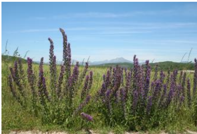
Con frecuencia puede verse la viborera. Tiene diminutas y delicadas flores.

Km. 31,900 En descenso hasta este punto, en el cual se gira a mano izquierda. Se entra en un camino de tierra rojiza.