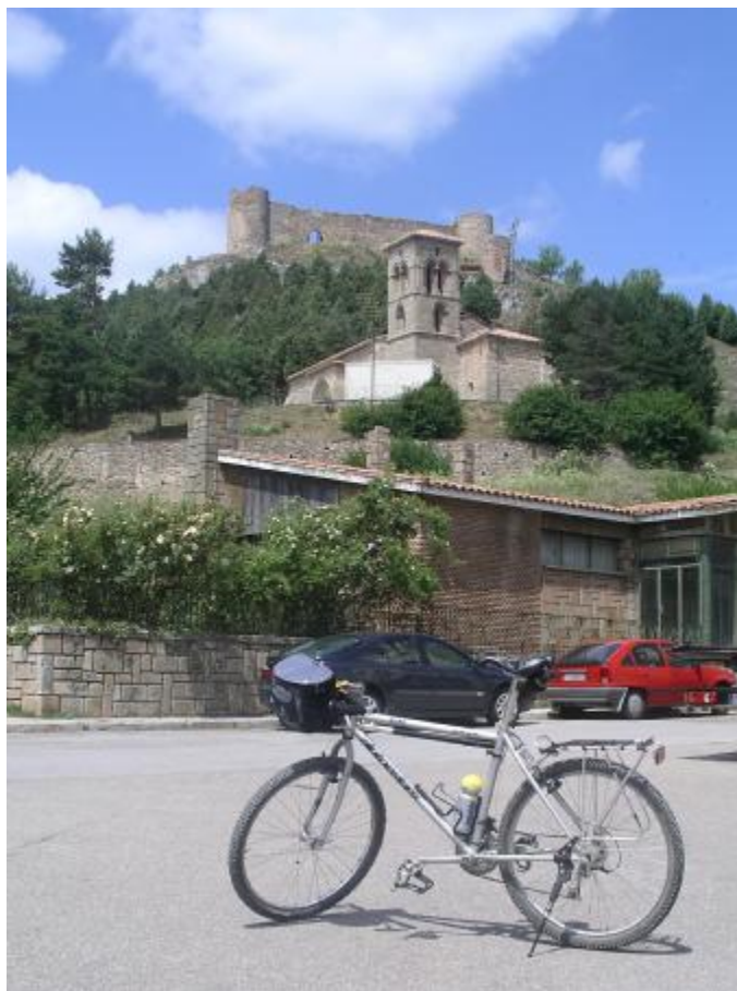
AGUILAR. Se alcanza la población en este admirable lugar.

NOTA.- Si se deseara visitar esta interesantísima población, sugiero retirar el cuentakilómetros de su habitáculo, realizar la visita, regresar a este punto y ponerlo de nuevo. De esta manera podrían seguirse las referencias kilométricas que vamos indicando.