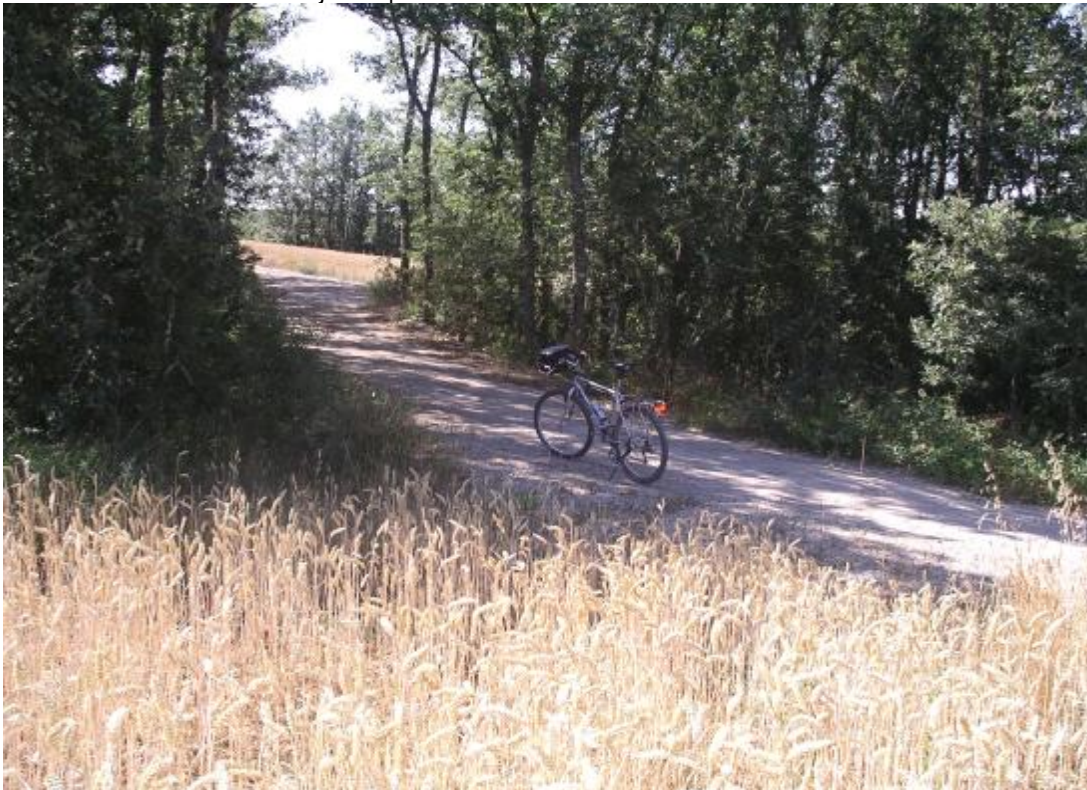
El camino circula con frecuencia rodeado de árboles. En este caso, además, se acompaña de cereal en ambas márgenes. ¿Se puede pedir más?

Km. 9,520 Alto del repechito que ha tenido rampas del 5 %, como máximo. Desde aquí vemos: al frente, Matamorisca y a mano derecha la cordillera de Fuentes Carrionas, con Espigüete y Curavacas como mejores exponentes.